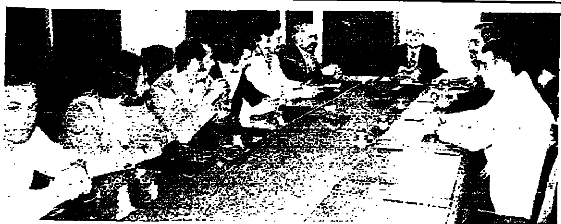
الرئيس الصلح يراس اجتماع اللجنة المشتركة ويبدو الى اليمين الجانب اللبناني والى اليسار الجانب الفلسطيني